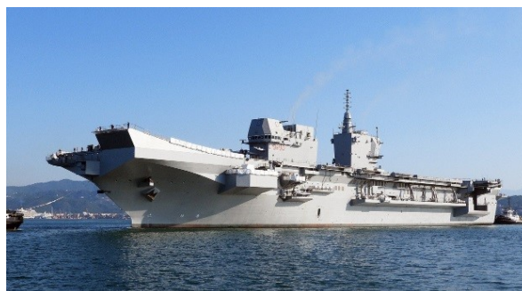
Le Trieste équipé de son « Ski-jump ».

La surface du pont est déjà équipée d'un revêtement spécial pour résister aux températures élevées des tuyères du F-35.